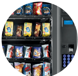
Ein elegantes und aufgeräumtes Design