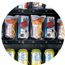
Perfekte Sicht des Verkaufsinnenraums